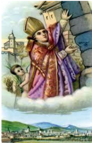
Sant'Emidio Vescovo e martire Protettore contro i terremoti

Organizzata da Movimento Apostolico Sordi dell'Abruzzo e delle Marche Suore e Padri Piccola Missione per i Sordomuti in collaborazione con Ente Nazionale Sordomuti di Ascoli Piceno